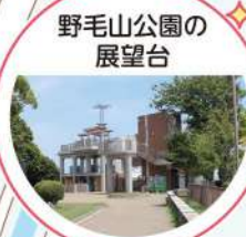
野毛山公園の 展望台

【編集】第4地区自治会連合会、第4地区社会福祉協議会(nishi4.shakyo@gmail.com)