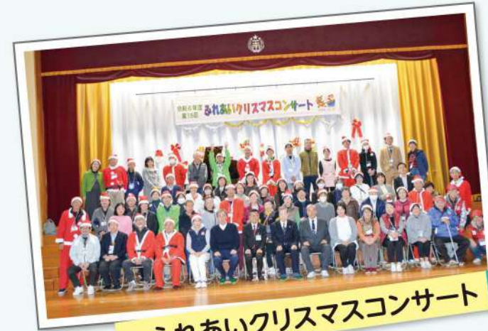
ふれあいクリスマスコンサート