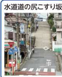
水道道の尻こすり坂