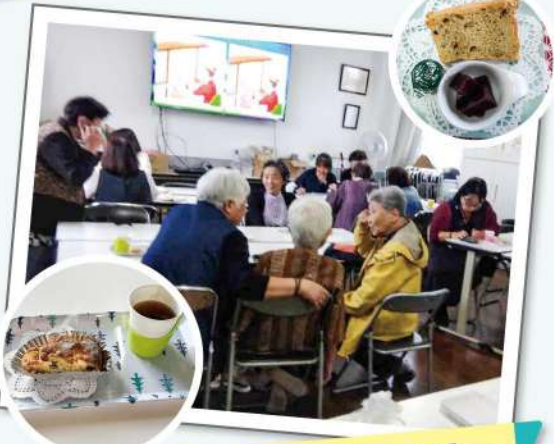
アフタヌーンカフェ