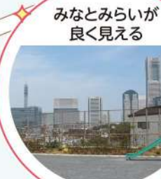
みなとみらいが 良く見える